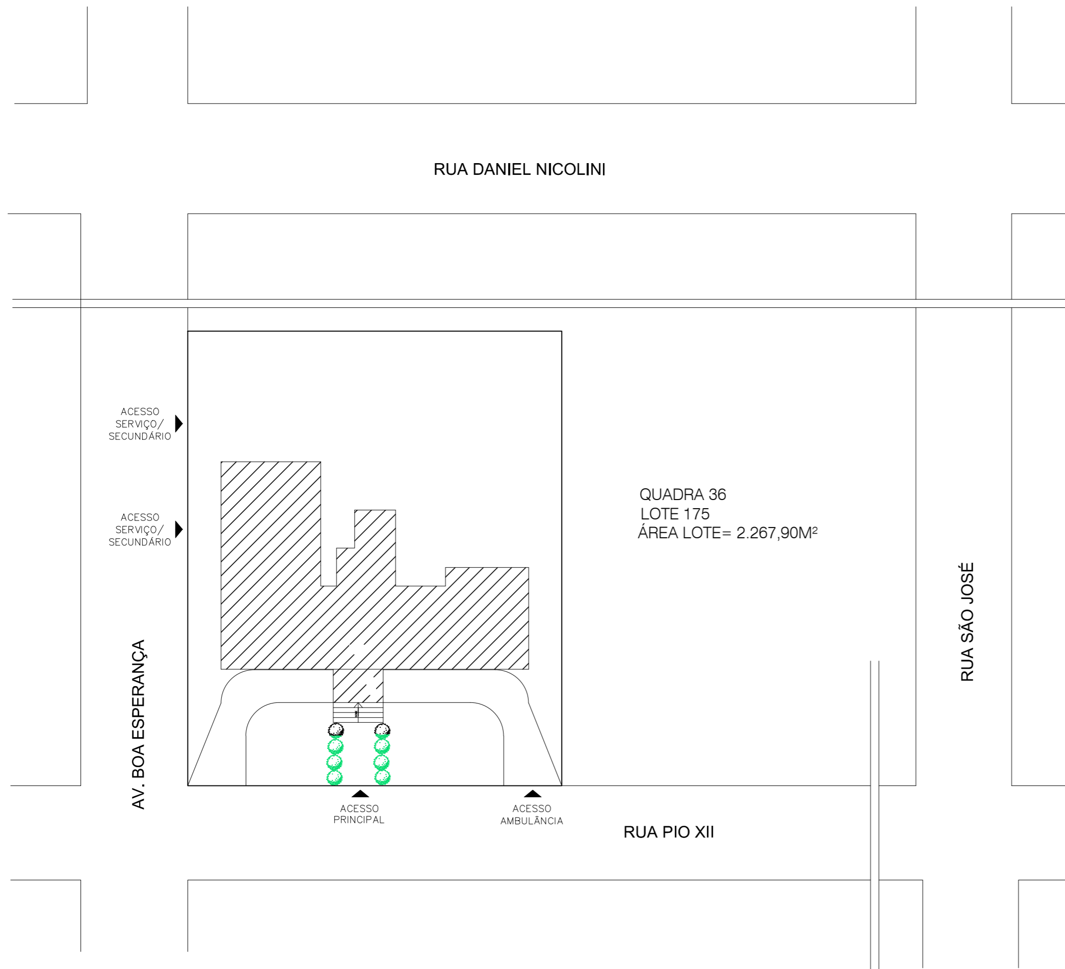
01 PLANTA BAIXA - SITUAÇÃO E LOCALIZAÇÃO ESC. 1/500 ÁREA: 683,00 m 2