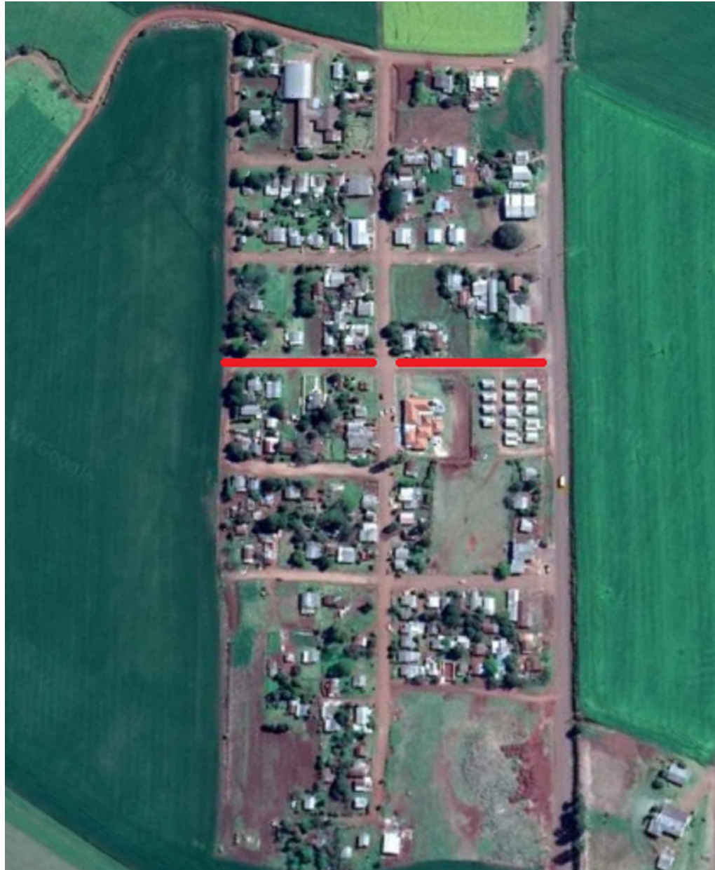
Rua Raquel de Queiroz