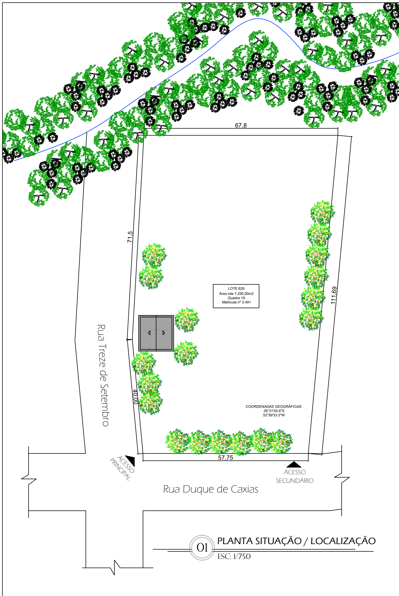
01 PLANTA SITUAÇÃO / LOCALIZAÇÃO ESC: 1/750